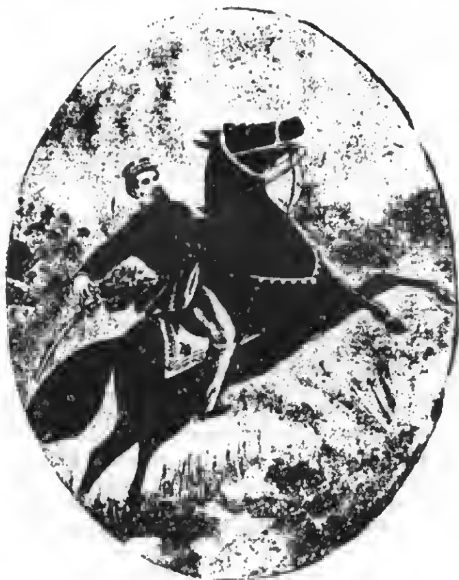
Brigadeiro João Manuel Mena Barreto. Esta fotografia foi tirada de uma tela representando o general João Manuel Mena Barreto, quando, gravemente ferido na batalha de Peribebui em 11 de agosto de 1869, morreu heroicamente à testa da coluna que comandava.

flanco pela ala contrária a Curupaiti, contornando as posições do inimigo até Tuiú Cué, apoderando-se do Estabelecimento e do Taiú à beira do rio Paraguai. O Exército acha-se além de Humaitá e a Esquadra, com seu abastecimento garantido por ele, força a passa-